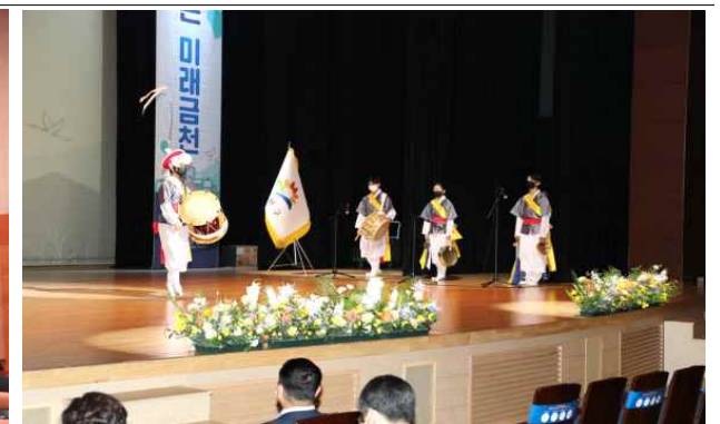
제25회 구민익날 식전공연