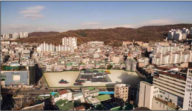
시흥행궁 추정지(시흥5동 830번지 일원)