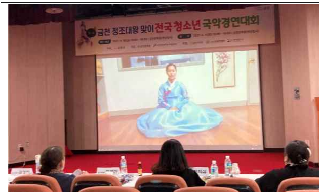
2021년 금전 정조대왕 맞이 국악경연대회