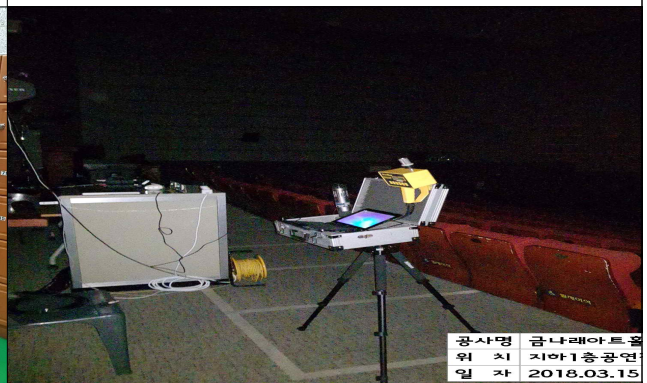
공사명 금나래아트홀 위 치 지하1층공연 일 자 2018.03.15