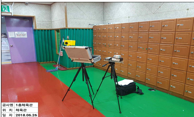
공사명 1층체육관 위 치 체육관 일 자 2018.06.26