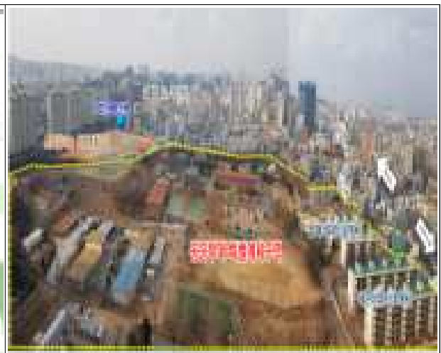
< 전 경 >