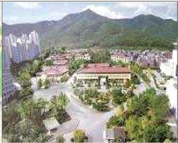
< 건물전경 >