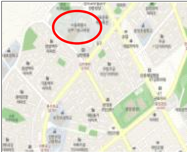
< 위치도 >